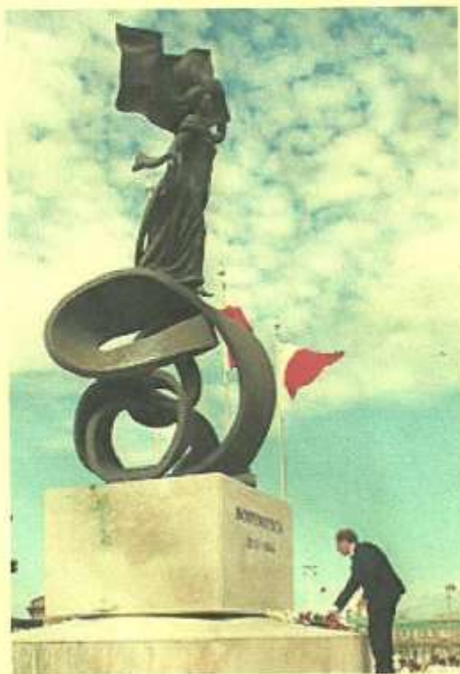
Le président de la République de Malte, George Abela, déposant une gerbe au pied du monument de l'Indépendance

Le 21 Septembre célèbre le jour de l'indépendance de Malte, Cette journée commémore le jour où l'île a acquis son indépendance par rapport à la Grande-Bretagne en 1964, Parade militaire à La Valette et concerts à Rabat, sont organisés pour fêter ce jour important.