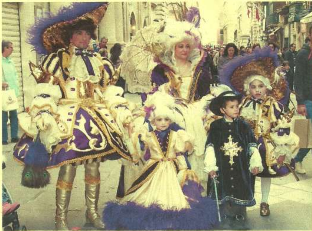
Everybody dressed up for this event

L'origine du carnaval remonte à une tradition séculaire depuis le moyen-âge, les chevaliers de St-Jean encourageaient cette fête au cours de laquelle de jeunes hommes étaient mis au défi de prouver leur force pendant que la noblesse participait à un bal costumé.